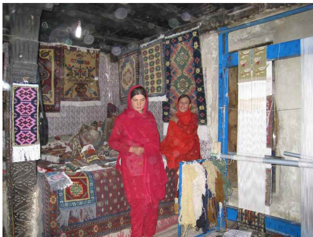
Det blev det lilla tygstycket i lila på pelaren till vänster i bild, matta är väl kanske fel begrepp.

Åter till dagens tur... Vägen gick som alltid genom grönskande dalgångar. Eftersom det ännu var tidigt på morgonen var det knappt något folk ute, en del låg ute och sov i dessa utomhussängar som jag tidigare berättat om. Det doftade dock utav rök lite här och var och solen hade inte letat sig ner i dalgångarna än utan lyste bara på de snöklädda bergstopparna.