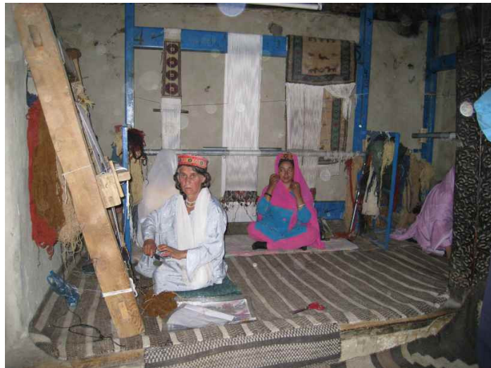
En liten interiörbild från väveriet

Vi skulle först passera Karimabad i Hunzadalen, där vi varit tidigare, innan vi skulle komma på för oss ny väg. Eller faktiskt så hade vi dagen innan varit och besökt Gulmit som är staden efter Karimabad och här hade jag passat på att köpa en liten matta. Så här kommer lite bilder från det innan vi går vidare med dagens tur.