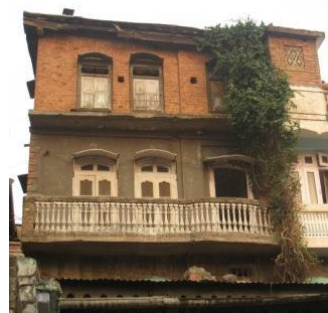
Poonch den 9 oktober 2008