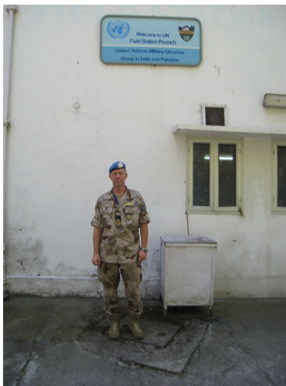
Sista natten i Poonch – Lördag 18 Oktober 2008

På kvällen hade vi en avskedsmiddag och det var väldigt trevligt. En kalasgod – ja, just det kyckling curry. Avslutade med någon timme till på kontoret – fy vad papper det det skall produceras. Nu väntar Srinagar.