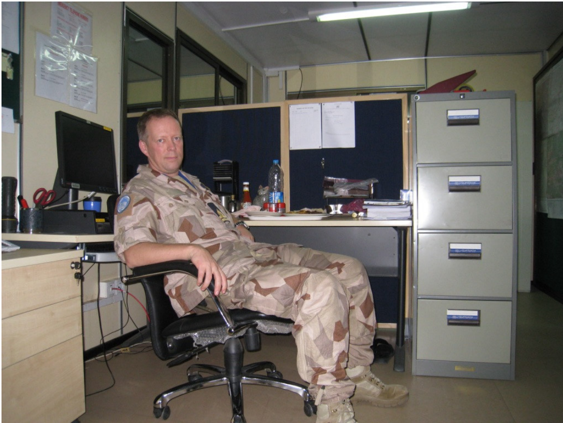
Självutlösare med kameran balanserad på en fax!

skakade till vid en av smällarna. Natten avlöpte lugnt och morgonen kom fortare än jag anat... Har man varit DO får man gå hem om läget medger och eftersom det är Eid är det kalaslugnt så jag knallade hem vid 10.00.