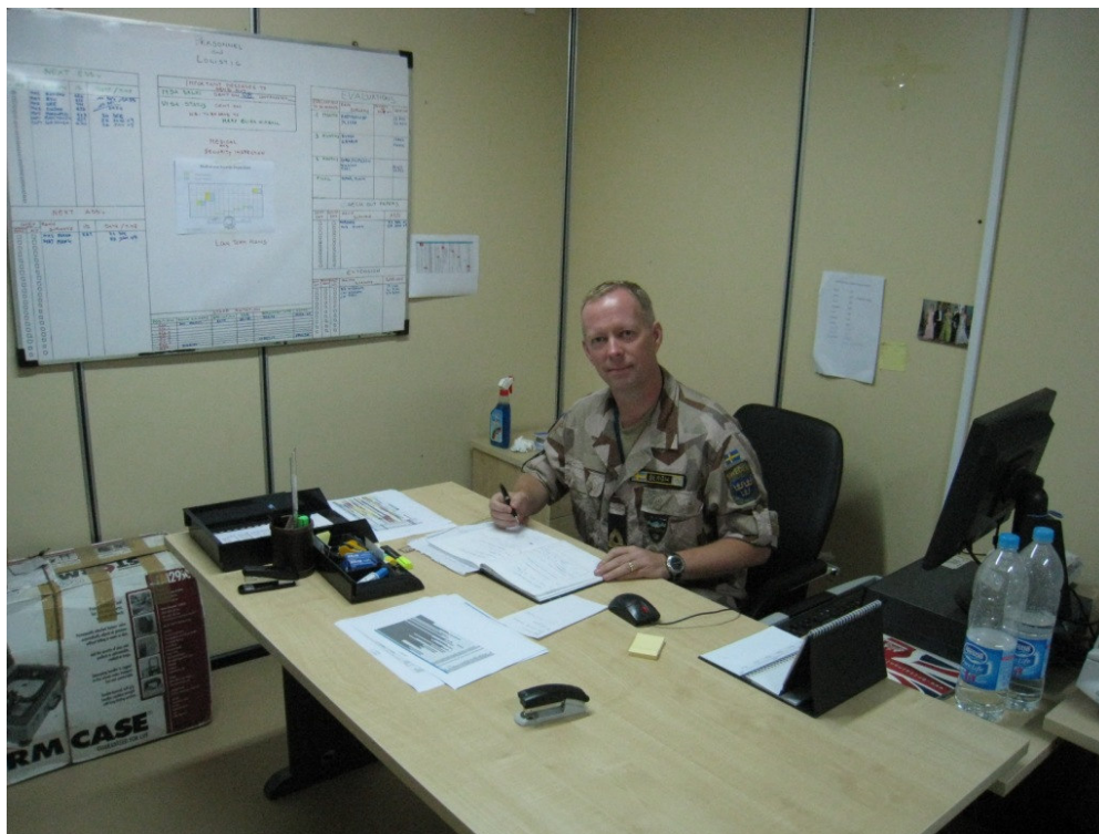
Här ser vi undertecknad i en fin kontorspose

Det kommer in ledighetsansökningar, betyg skall skrivas, nya observatörer som skall skolas in, observatörer som åker hem skall avslutas i de administrativa rutinerna, trasiga varmvattenberedare på fältstationer, hastiga omflyttningar av personal på fältstationerna, m.m. Dagarna går i ett rasande tempo men av naturliga skäl blir det inte lika mycket bilder längre men lite Islamabadbilder kan ju vara intressant. Eftersom jag inte rör mig så mycket ute i terrängen minskar också kontakten med den Pakistanska landsbygden där man får de mesta intrycken. Islamabad är i mångt och mycket väldigt ”opakistanskt”. Dels så byggdes staden utifrån ett modernt arkitektoniskt synsätt, på 50-60-talet, i ett rutnätssystem med en indelning i sektorer där varje sektor delats upp i fyra kvadranter. Tex så bor vi nu i sektor F7 kvadrant 2, mao ord blir adressen F7/2.